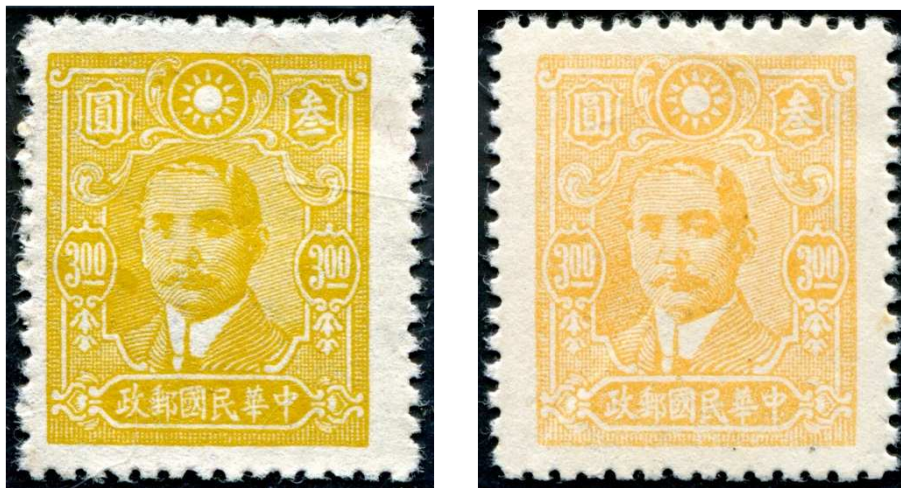
Abb. 1: Die Farbe „gelb“ bei links Mi.Nr. 459 und rechts Mi.Nr. 592

Beide Marken haben nach dem Michel-Katalog China 2013 die Farbbezeichnung „gelb“. Schon diese Farbbezeichnung „gelb“ zeigt eine erste Möglichkeit auf, beide Marken unterscheiden zu können, Abb. 1: