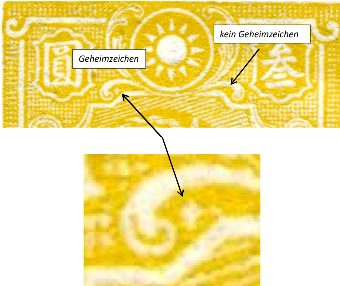
Abb. 2: Geheimzeichen bei der MiNr. 459

Zunächst das Geheimzeichen bei der Mi.Nr. 459 (Abb. 2):