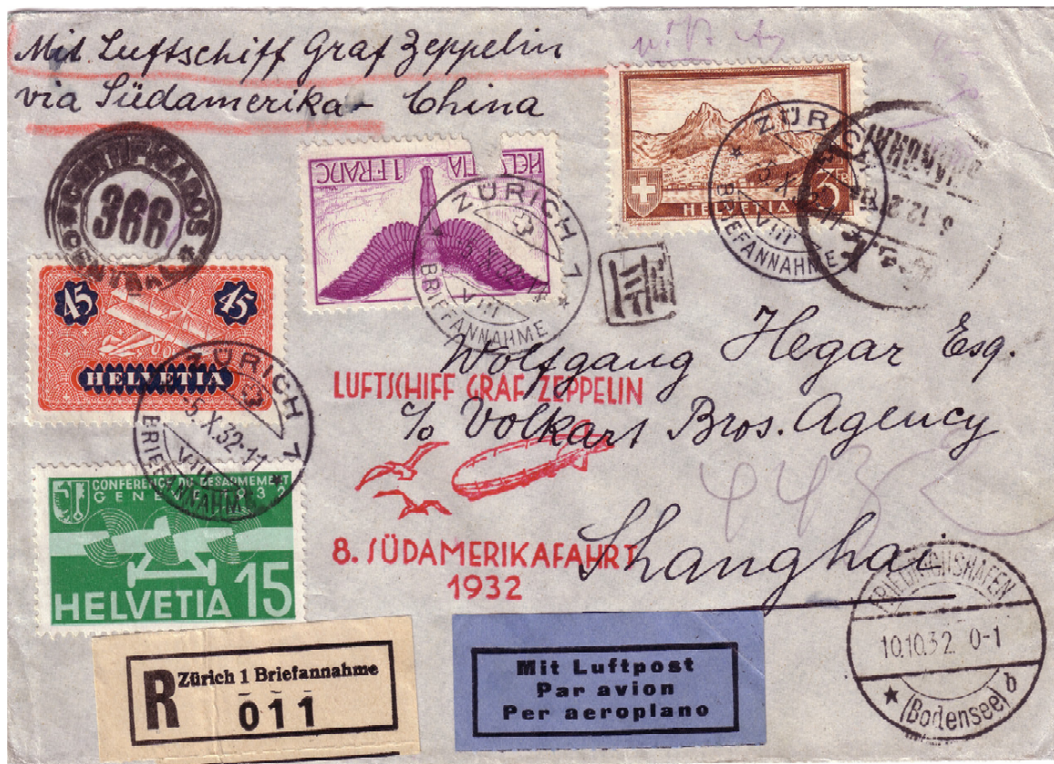
Abb. 3: Luftpostbrief von Zürich (5.10.1932) über Friedrichshafen (10.10.1932)-Südamerika (13.10.1932) nach Shanghai (6.12.1932)

Aufgrund der schnellen Zeppelinbeförderung erreichte der Brief Südamerika bereits am 13. Oktober 1932, aber in Shanghai kam der Brief erst am 6. Dezember 1932 an. Das war die langsamste Beförderung und sicherlich der letzte über Südamerika nach Shanghai gesandte Brief.