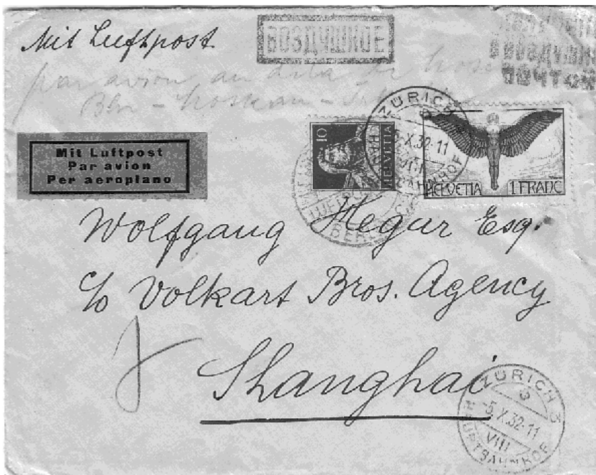
Abb. 1: Luftpostbrief von Zürich (5.10.1932) über Berlin (6.10.1932) -Moskau-Irkutsk nach Shanghai (2.12.1932)

Der abgebildete Brief, Abb. 1, wurde in Zürich am 5. Oktober 1932 aufgeliefert und mit Luftpost über Berlin und Moskau nach Irkutsk geflogen, von dort ging es mit der Eisenbahn weiter bis zum Volkart Bros. Büro in Shanghai. Dies war einer von mehreren Zürich-Shanghai Testbriefen, um die genauen Postlaufzeiten zwischen diesen Städten zu erfahren.