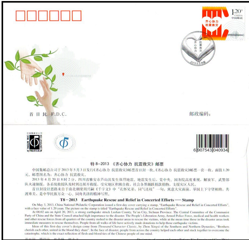
Abb. 2: Sonderumschlag mit Marke und Ersttagsstempel

Postkarte wurde von den Postämtern Lei Feng und Zizhouyuan in Peking vertrieben.