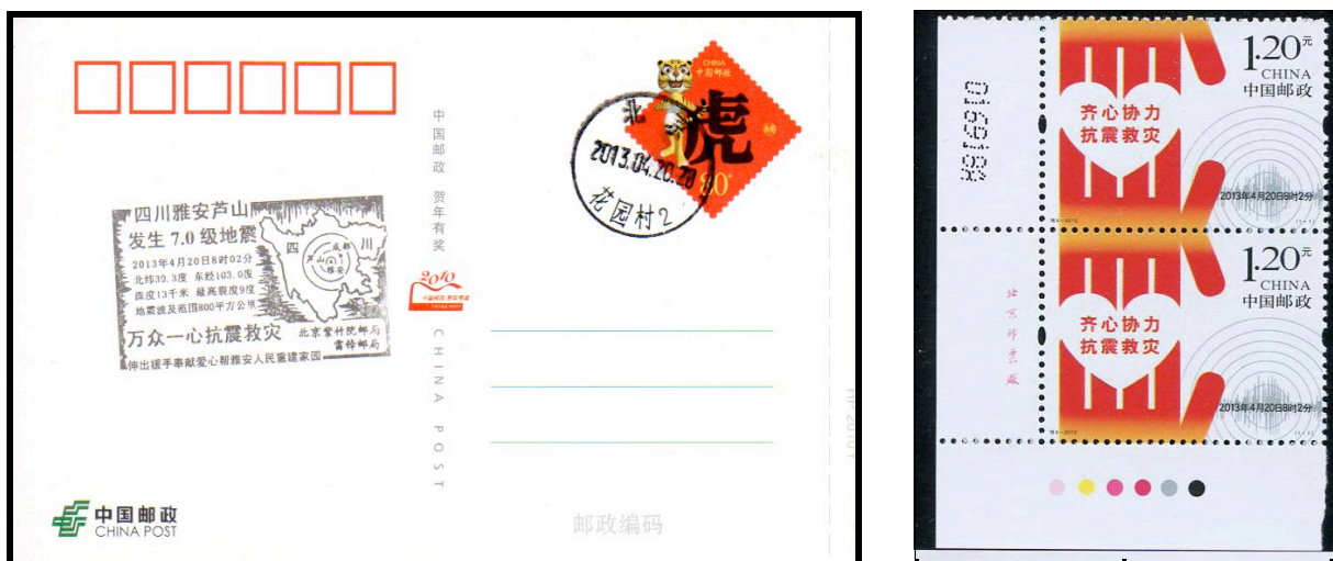
Abb. 3: Sonderkarte (links) und Markenpaar vom linken unteren Eckrand mit Druckerzeichen und Nummer (rechts)

Die aktuellen Marktpreise liegen für die ungestempelte Marke bei ca. 20 RMB (2,50 €) und 30 RMB (3,70 €) für den Ersttagsbrief. Die Marken wurden in Kleinbögen zu 14 Marken verkauft.